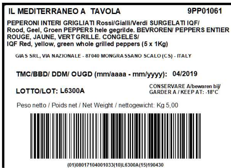
Figura 4: Esempio di etichetta - tracciabilità pallet: