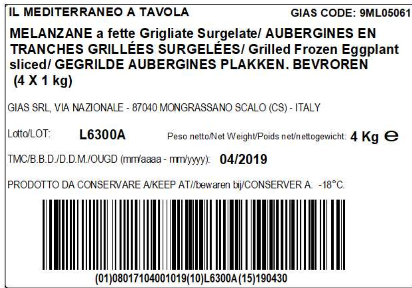
Figura 4: esempio di etichetta tracciabilità pallet